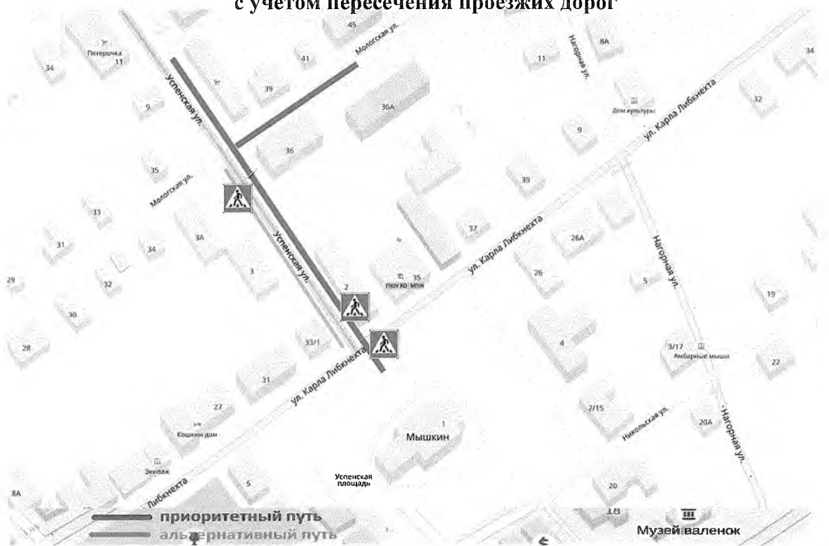
СХЕМА МАРШРУТА до ГПОУ ЯО Мышкинского политехнического колледжа с учетом пересечения проезжих дорог